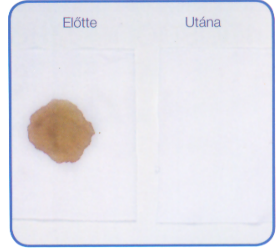
Ariel Formula Pro+ mosóporral mosott betadinfolt

A biocidokat biztonsággal alkalmazza! A használatot megelőzően mindig olvassa el a terméken szereplő információt!