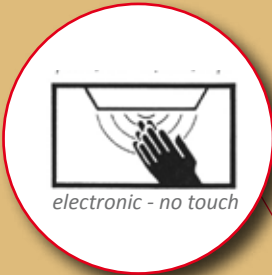
electronic - no touch

Berührungslose Aktivierung mittels IR-Sensoren. + Einfache, sichere Bedienung auch für Kinder und Menschen mit Behinderung. Touch-free activation through IR sensors. + simple, safe handling also for children and disabled people.