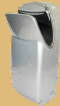
silber / silver